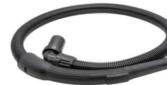
1,3 m Saugschlauch. Art.-Nr. 119.124