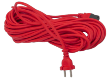
15 m steckbares Netzkabel. Art.-Nr. 119.119