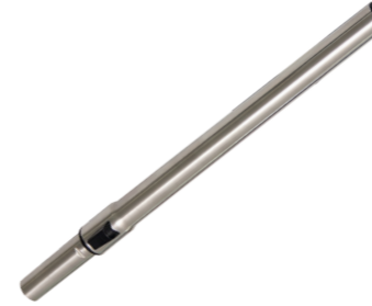
Edelstahl Teleskoprohr 0,6 – 1,0 m. Art.-Nr. 111.133