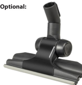
Flachbodendüse 280 mm Art.-Nr. 119.126