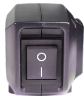
Powerknopf einfach zu erreichen.