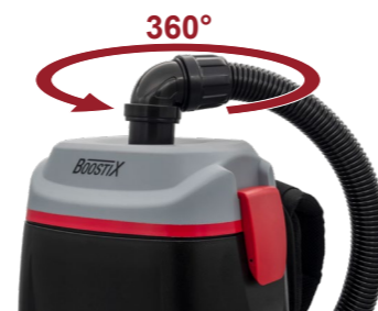
360° Drehgelenk, grenzenlose Beweglichkeit.