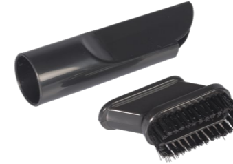
2in1 Fugen- / Polsterdüse. Art.-Nr. 115.127