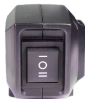
ECO-Modus bei der Akkuversion.