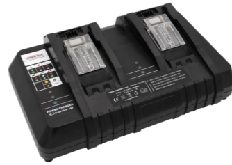
Doppel-Schnellladegerät. Art.-Nr. 119.120