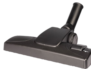
Kombidüse 280 mm Art.-Nr. 114.114