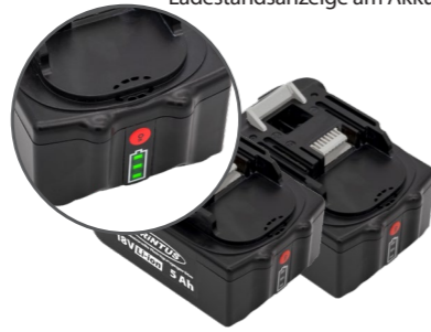
2 x 18 V Li-ion, 5 Ah Akkus. Art.-Nr. 119.121 (einzeln)