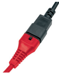
Steckbares Netzkabel und integrierte Kabellösung.