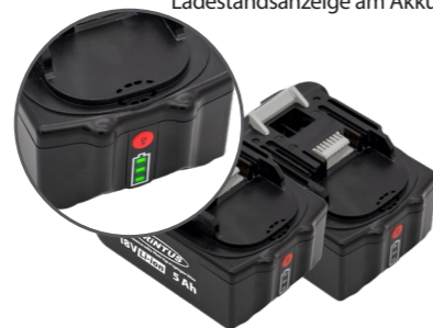
2 x 18 V Li-ion, 5 Ah Akkus. Art.-Nr. 119.121 (einzeln)