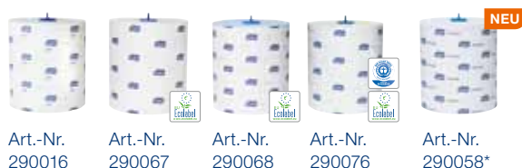
Art.-Nr. 290016 Art.-Nr. 290067 Art.-Nr. 290068 Art.-Nr. 290076 Art.-Nr. 290058*

* ersetzt Art.-Nr. 290057 ** bei Verwendung im manuellen Tork Elevation Rollenhandtuchspender bzw. einer durchschnittlichen Abrisslänge von 24,5 cm