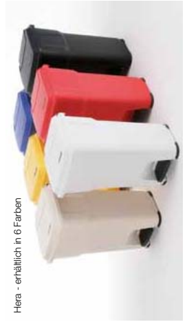
Hera - erhältlich in 6 Farben