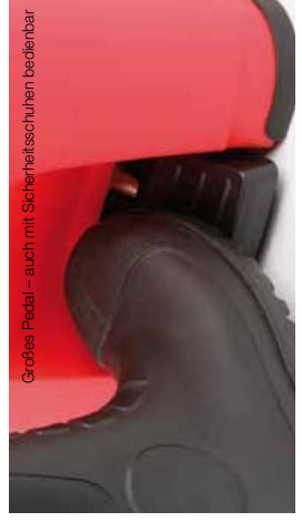
GroÙes Pedal – auch mit Sicherheitsschuhen bedienbar