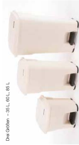
Drei Größen – 35 L, 60 L, 85 L