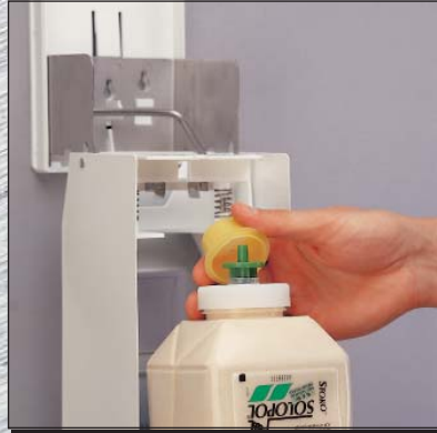
Entfernen der Staubkappe