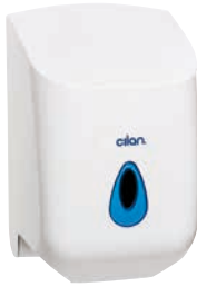
CILAN SYSTEM CENTERFEED SPENDER CF 10 ArtNr: 83602-000 ArtNr Igefa: 2149746 Material: Kunststoff weiß Maße: 36x22x23 Spender/VE: 1