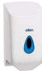
CILAN SYSTEM CENTERFEED SPENDER CF 11 ArtNr: 83603-000 ArtNr Igefa: 2149748 Material: Kunststoff weiß Maße: 32x17x18 Spender/VE: 1