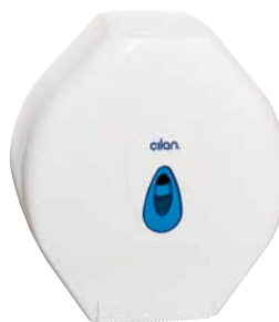
CILAN SYSTEM TOILETTPAPIERSPENDER JUMBO TJ10 ArtNr: 83606-000 ArtNr Igefa: 2149751 Material: Kunststoff weiß Maße: 38x34x15 Spender/VE: 1