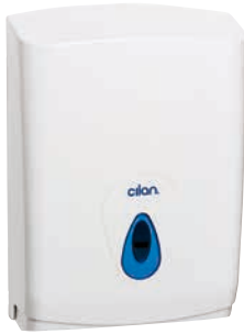
CILAN SYSTEM FALHANDTUCHSPENDER HT 10 ArtNr: 83600-000 ArtNr Igefa: 2154586 Material: Kunststoff weiß Maße: 42x28x15 Spender/VE: 1