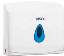
CILAN SYSTEM FALHANDTUCHSPENDER HT 11 ArtNr: 83601-000 ArtNr Igefa: 2149745 Material: Kunststoff weiß Maße: 26x28x15 Spender/VE: 1