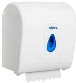
CILAN SYSTEM AUTOCUT SPENDER AC 10 ArtNr: 83604-000 ArtNr Igefa: 2149749 Material: Kunststoff weiß Maße: 34x31x21 Spender/VE: 1